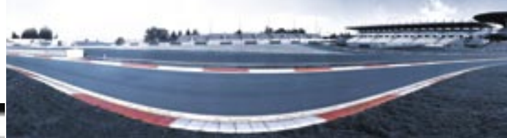
Der Nürburgring – als „Grüne Hölle“ bei Generationen von Motorsportenthusiasten bekannt – ist bis heute die eigentliche Teststrecke der AC Schnitzer Entwicklungsingenieure.