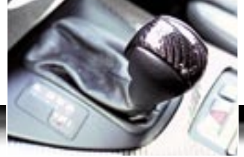
Der AC Schnitzer Automatik-Schaltknopf aus Carbon.