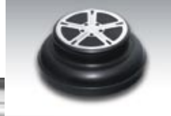
Das AC Schnitzer Aluminium Cover im Design der Typ IV-Felge.

Neben einer Carboninnenausstattung in schwarz oder silber sorgen ergonomisch geformte Sport-Airbag-Lenkräder, Aluminium-Handbremsgriffe, Carbon-Automatikwählhebel – in schwarz oder silber – edle Velours Fußmatten und eine Aluminium-Pedalerie mit Fußstütze für authentisches Motorsport-Feeling.