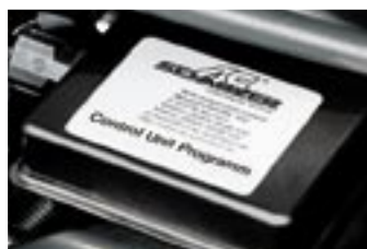
Mehr Leistung bei gleichem Verbrauch: Die Dieselleistungssteigerungen von AC Schnitzer erhöhen den Wirkungsgrad der Serientriebwerke ohne nennenswerten Mehrverbrauch.