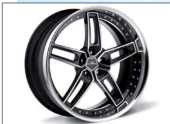
Typ VIII Rennsport-Schmiede- felgen BiColor