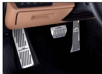
Aluminium Pedalerie, Fußstütze, Velours Fußmatten