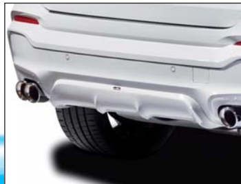
Heckschürzenschutzfolie, Heckdiffusor (M-Technik)