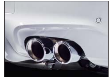
Schalldämpfer mit 2 „Sport“ Endblenden