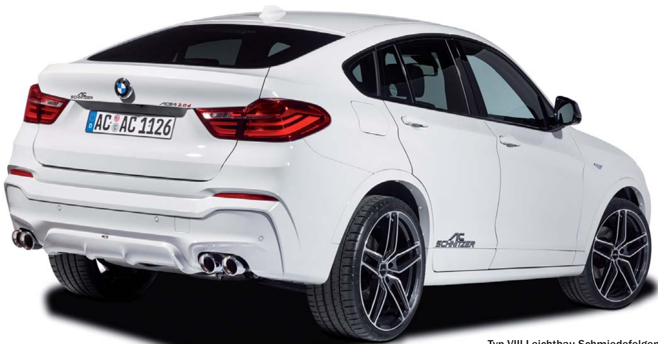
Typ VIII Leichtbau-Schmiedefelgen BiColor