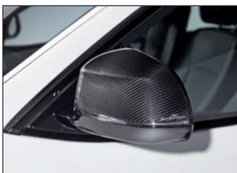
Carbon Spiegel Cover