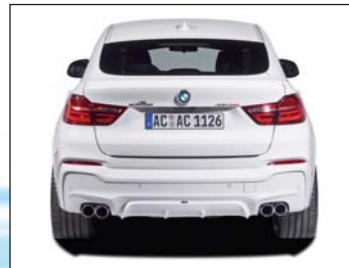
Heckschürzenschutzfolie, Heckdiffusor (M-Technik), Schalldämpfer mit 2 „Sport“ Endblenden