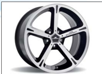
Typ IV Felgen BiColor schwarz oder silber