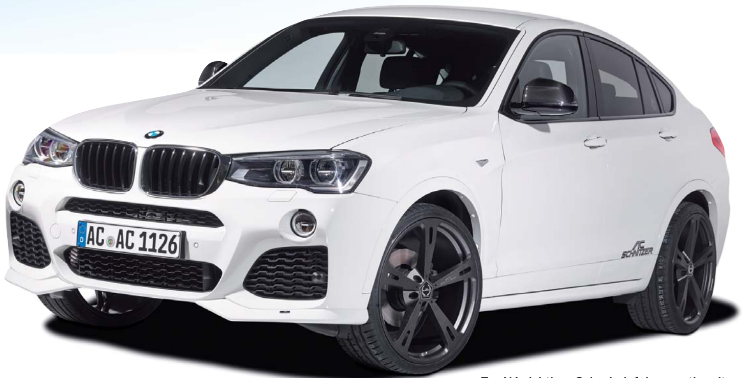
Typ V Leichtbau-Schmiedefelgen anthrazit