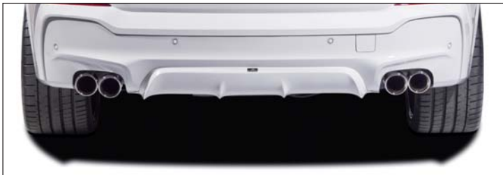
Heckdiffusor (M-Technik), Schalldämpfer mit 2 „Sport“ Endblenden