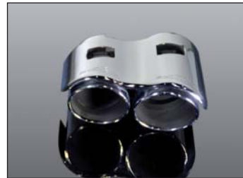
Endblenden „Racing Evo“