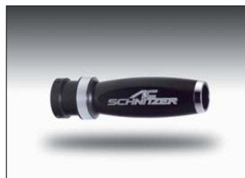
Handbremsgriff „Black Line“