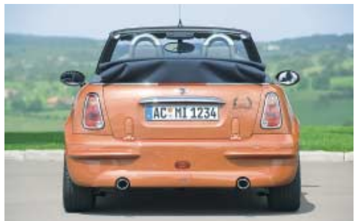
Markante Front, dynamisches Heck: Mit Aerodynamik-Komponenten aus PU-Rim und Doppelrohr-Auspuffanlage aus V2A mit verchromten Endblenden.