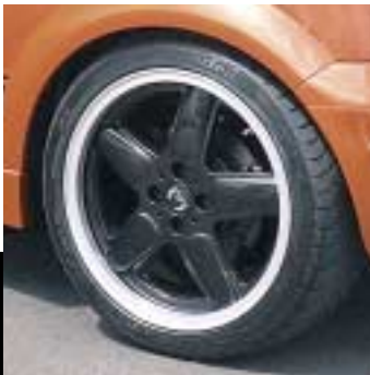
AC Schnitzer Leichtmetallfelge Typ I: Der Klassiker mit Felgenstern in Schwarz oder Wagenfarbe lackiert kombiniert mit einem polierten Ring. Das passt.

Der Duft von Raum und Zeit, den man sich im MINI Cabrio by AC Schnitzer um die Nase wehen lassen kann, hat eine ganz eigene dynamische Note. Die Atmosphäre exklusiver Materialien, die Formgebung edlen Designs und die überlegene Technik aus dem Motorsport heben das Cabrio-feeling in neue, höhere Sphären. Immer offen, immer sportlich.