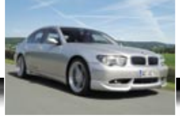
Der AC Schnitzer Fahrwerksfedersatz ist optimal auf die Limousine abgestimmt.