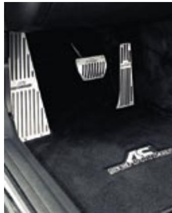
Fein, fein: Das AC Schnitzer Aluminium-Cover für das BMW i-Drive-System, die Aluminium-Pedalerie und die Veloursmatten mit Logo – alles gibt dem feinen Ambiente den letzten individuellen Schliff.