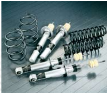
AC Schnitzer Sportfahrwerk und Federsatz.