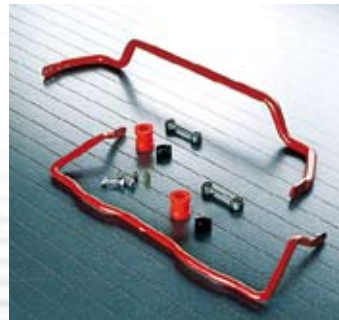
AC Schnitzer Spezial-Stabilisator-Satz.