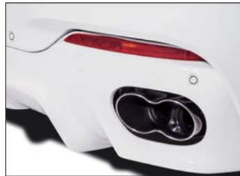
Schalldämpfer oder Doppelschalldämpfer mit 2 „Racing“ Endblenden