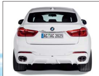
Heckdiffusor, Doppel-Schalldämpfer mit 2 „Racing“ Endblenden