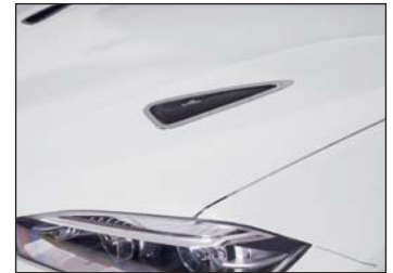
Bonnet Vents (Export) mit Chromelementen