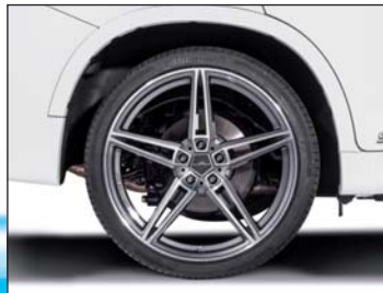
AC1 Leichtmetallfelgen BiColor oder Anthrazit