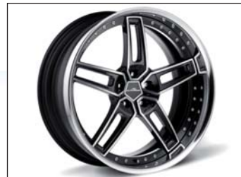
Typ VIII Rennsport- Schmiedefelgen BiColor