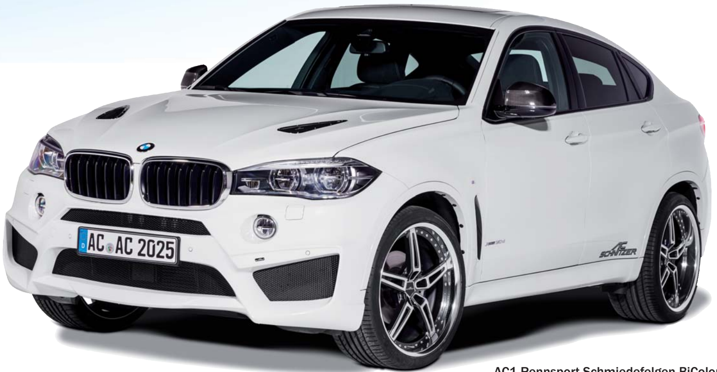
AC1 Rennsport-Schmiedefelgen BiColor