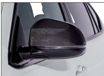
Carbon Spiegel Cover