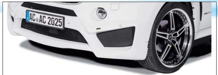
Frontschürze, AC1 Rennsport-Schmiedefelgen