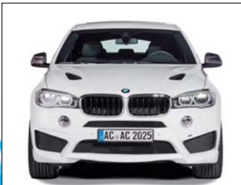
Carbon Spiegelcover, Bonnet Vents, Frontschürze