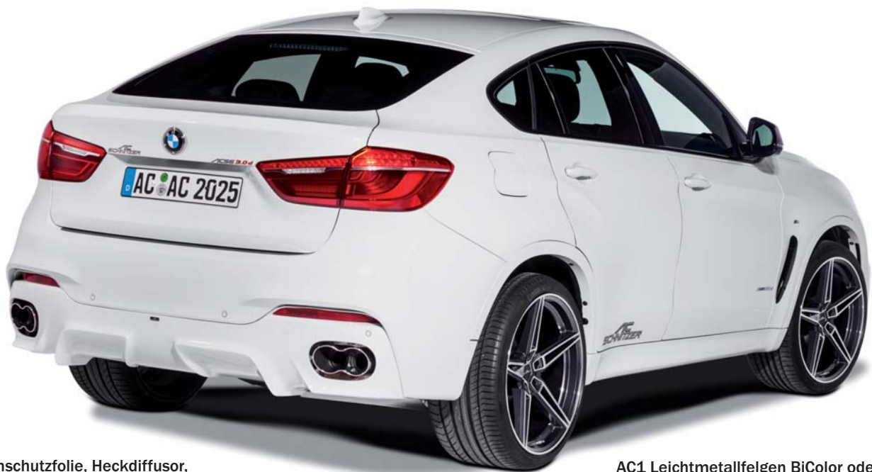
Heckschürzenschutzfolie, Heckdiffusor, Doppel-Schalldämpfer mit 2 „Racing“ Endblenden