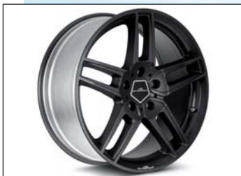
Typ VIII Leichtmetallfelgen Anthrazit