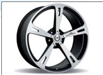
Typ V Leichtbau-Schmiedefelgen BiColor oder Anthrazit