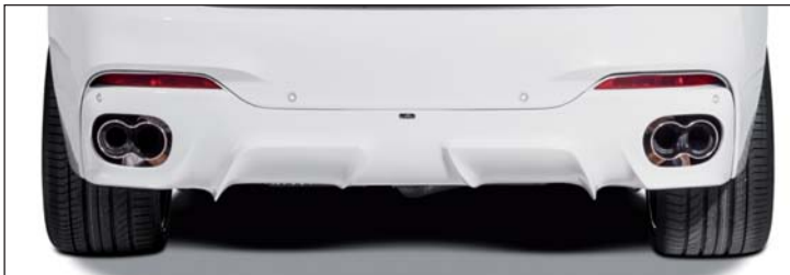
Heckdiffusor, Schalldämpfer oder Doppel-Schalldämpfer mit 2 „Racing“ Endblenden