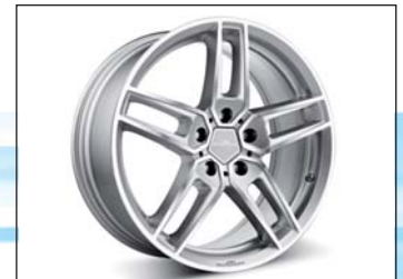
Typ VIII Leichtmetallfelgen BiColor Silber o. BiColor Schwarz